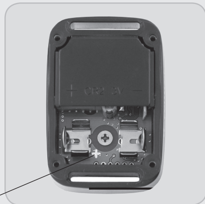
Signo de la polaridad de la pila